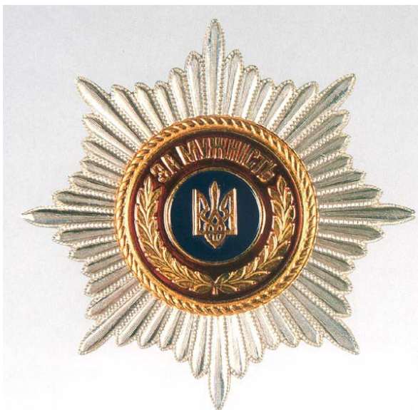
Мал. 2 Відзнака Президента України Зірка «За мужність»