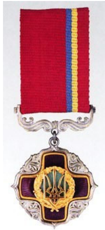
Мал. 1 Почесна відзнака Президента України. 1992 рік

Канонам фалеристики відповідали Описи відзнаки і мініатюри.