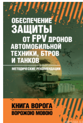
Обеспечение защиты от FPV дронов автомобильной техники, БТРов и танков. Книга ворога ворожою мовою