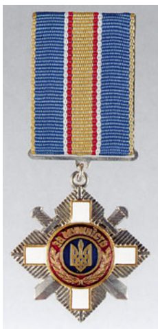
Мал. 3 Відзнака Президента України Хрест «За мужність»