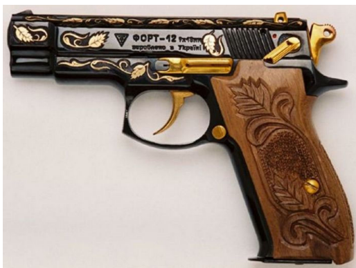
Мал. 4 Відзнака Президента України «Іменна вогнепальна зброя»

Зовнішні деталі корпусу пістолета і рукоятки прикрашено художньою декоративною різьбою.