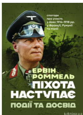
Піхота наступає. Події та досвід. Спогади про участь у боях 1914-1918 роках у Франції, Румунії та Італії