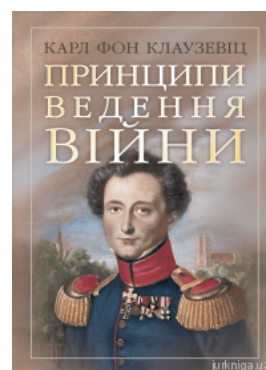
Принципи ведення війни