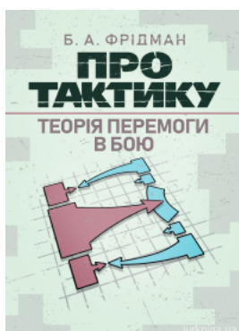
Про тактику. Теорія перемоги в бою