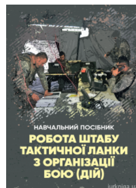
Робота штабу тактичної ланки з організації бою (дій)