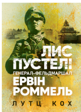
Лис пустелі. Генерал-фельдмаршал Ервін Роммель