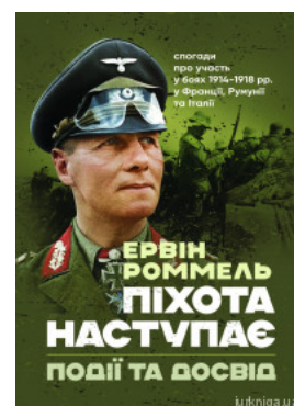
Піхота наступає. Події та досвід. Спогади про участь у боях 1914-1918 роках у Франції, Румунії та Італії