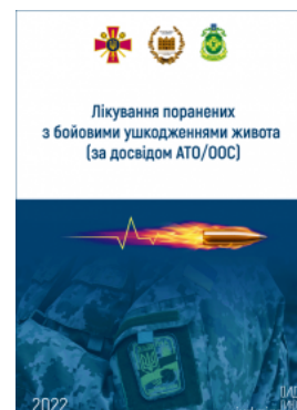
Лікування поранених з бойовими ушкодженнями живота (за досвідом АТО/ООС)