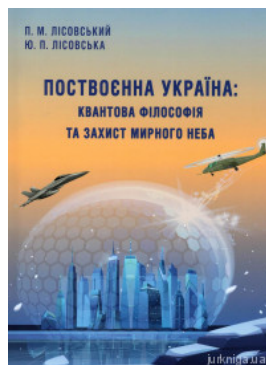
Поствоєнна Україна: квантова філософія та захист мирного неба