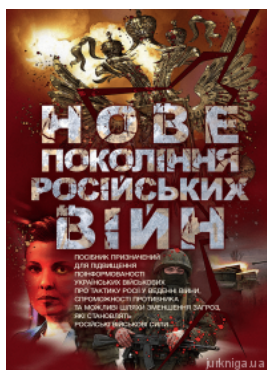
Нове покоління російських війн