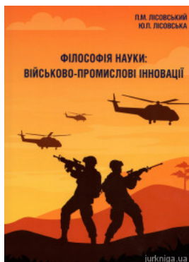
Філософія науки: військово-промислові інновації