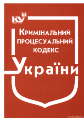
Кримінальний процесуальний кодекс України

Перейти до галузі права Кримінальне право та процес