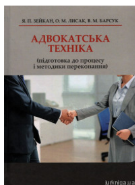
Адвокатська техніка (підготовка до процесу і методики переконання)