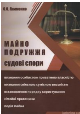
Майно подружжя. Судові спори