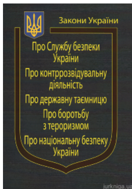
Закони України "Про службу безпеки України", "Про контррозвідальну діяльність", "Про державну таємницю", "Про боротьбу з тероризмом",...