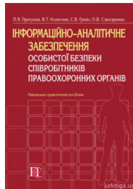
Інформаційно-аналітичне забезпечення особистої безпеки співробітників правоохоронних органів