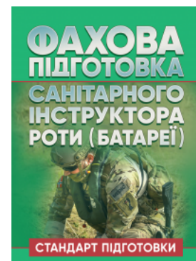
Фахова підготовка санітарного інструктора роти (батареї). Стандарт підготовки