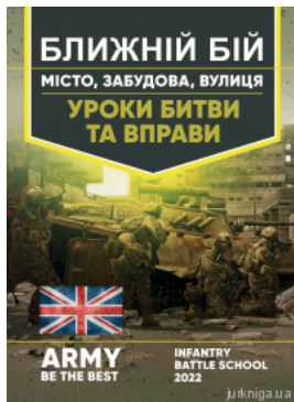
Ближній бій. Місто, забудова, вулиця. Уроки битви та вправи