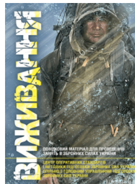
Вживання. Довідковий матеріал для проведення занять в Збройних силах України