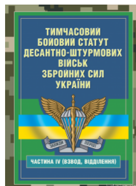
Тимчасовий бойовий статут Десантно-штурмових військ Збройних Сил України, частина 4 (Взвод, відділення).