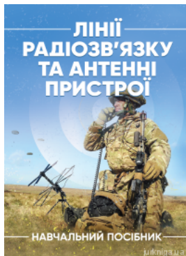
Лінії радіозв'язку та антенні пристрої