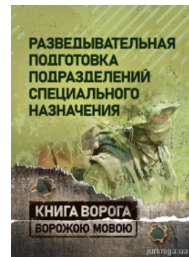
Разведывательная подготовка подразделений специального назначения. Книга ворога, ворожою мовою