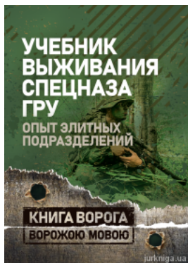
Учебник виживання спецназа ГРУ. Опыт элитных подразделений. Книга ворога, ворожою мовою