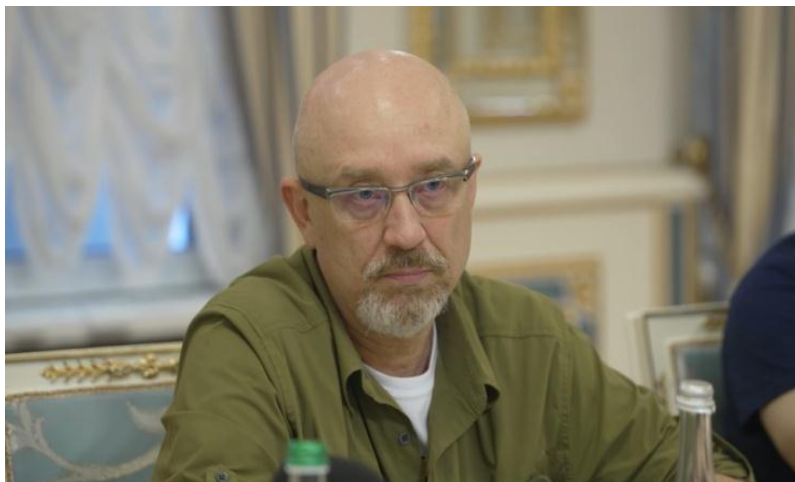
Міністр оборони України Олексій Резніков

Президент зазначив, що Україна не збирається обстрілювати територію РФ у разі надання ракет дальньої дії [13]. Наша держава готова вести мирні переговори з Росією, тільки якщо противник матиме намір покласти край війні [14].