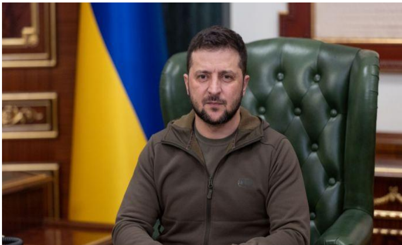
Президент України Володимир Зеленський

У травні стало відомо, що Президент України Володимир Зеленський та Головнокомандувач ЗС України генерал Валерій Залужний увійшли до переліку 100 найвпливовіших людей світу у 2022 році за версіями світових таблоїдів [5].