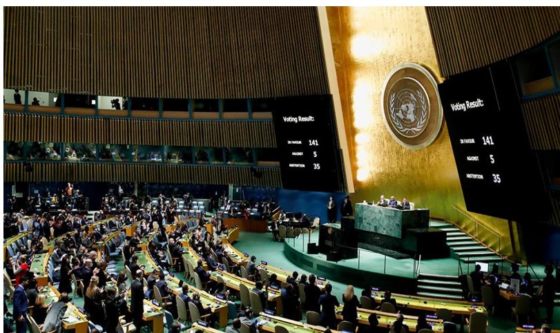
Засідання Генеральної Асамблеї ООН

Генеральна Асамблея ООН 2 березня 2022 року 141 голосом “за” ухвалила резолюцію “Агресія проти України”, “проти” були Росія, Білорусь, Північна Корея, Еритрея, Сирія. У документі беззаперечно визнано, що Росія вчинила агресію проти України, а також міститься вимога до РФ припинити вогонь. Держави – члени ООН рішуче вимагали від Росії вивести війська з України у межах її міжнародно визнаних кордонів [24].