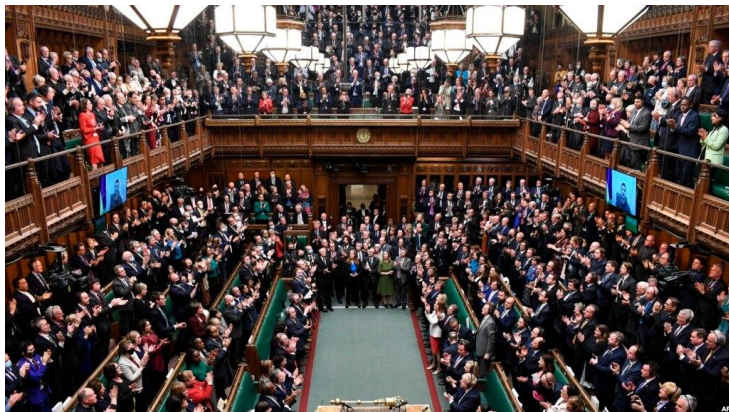
Палата громад парламенту Сполученого Королівства Великої Британії і Північної Ірландії під час відеозвернення Президента України Володимира Зеленського 08 березня 2022 року

платежів SWIFT, заморозити активи осіб, причетних до розгортання повномасштабної війни проти України; міжнародні компанії піти з російського ринку; підтримати членство України в ЄС та в подальшому посилювати зусилля, аби зупинити агресора.