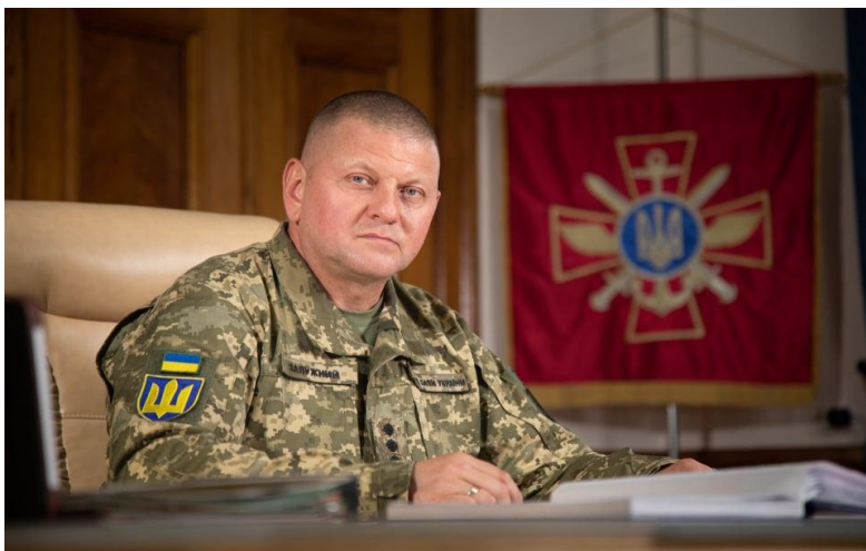
Головнокомандувач Збройних Сил України генерал Валерій Залужний

глобальна мета – деокупація і реінтеграція всіх територій України у міжнародно визнаних кордонах. Використовувати зброю для нападу на Росію чи захоплення її територій Україна не збирається. Ми не Росія. І наші партнери це розуміють” [16].