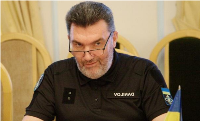
Секретар Ради національної безпеки і оборони України Олексій Данілов

Наступного дня Олексій Данілов зазначив, що війна закінчиться лише тоді, коли останні російські війська покинуть українську землю, включаючи Донбас і Крим. За словами Олексія Данілова, найшвидший спосіб припинити війну – це надати Україні необхідну зброю, щоб перемогти російську армію на полі бою [21].