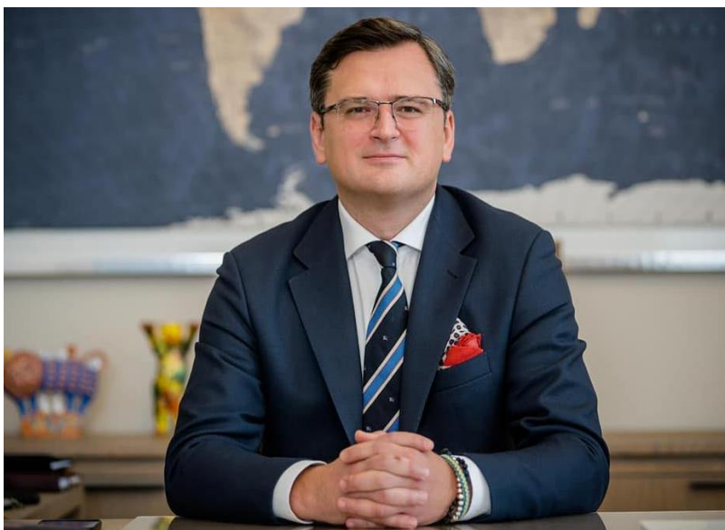
Міністр закордонних справ України Дмитро Кулеба

Україні сам на сам з Росією буде складно виграти в цій боротьбі, адже її військові перспективи на фронті залежать не лише від рівня командування Збройних Сил України, героїчних зусиль українських військових, а насамперед від обсягів і темпів західної підтримки. У важких оборонних боях українські військові мають виснажити противника, вибити його бронетехніку та “позбавити” його війська наступального потенціалу. Одночасно постачання сучасної важкої наступальної техніки та озброєння західних партнерів дасть змогу найближчим часом створити для ЗС України вирішальну перевагу на полі бою [22].