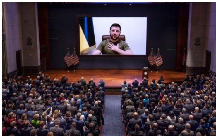
Президент України Володимир Зеленський звернувся до Конгресу США 16 березня 2022 року