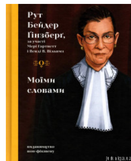
Моїми словами: біографія