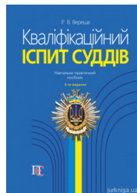
Кваліфікаційний іспит суддів: навчально-практичний посібник

Перейти до галузі права Філософія та психологія права