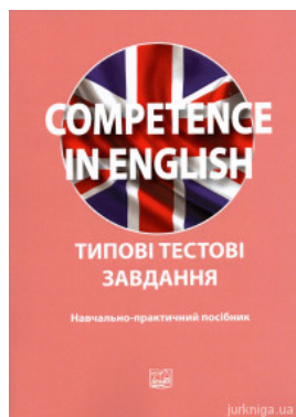
Competence in English. Типові тестові завдання