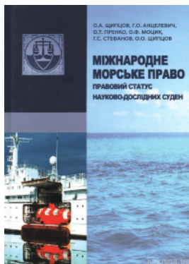
Міжнародне морське право: правовий статус науково-дослідних суден