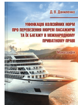
Уніфікація колізійних норм про перевезення морем пасажирів та їх багажу в міжнародному приватному праві