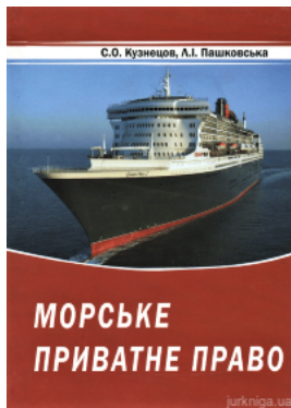
Морське приватне право