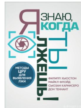
Я знаю, когда ты лжешь! Методы ЦРУ для выявления лжи