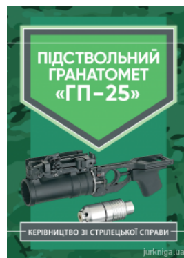
Керівництво зі стрілецької справи. Підствольний гранатомет "ГП-25"