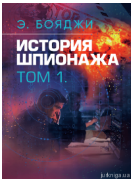
История шпионажа в двух томах