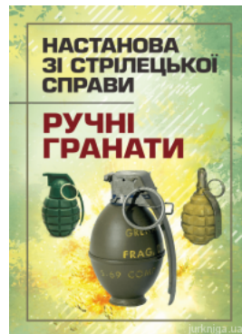
Настанова зі стрілецької справи. Ручні гранати