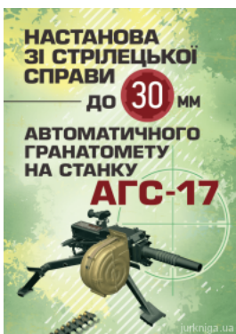
Настанова зі стрілецької справи до 30-мм автоматичного гранатомету на станку "АГС-17"