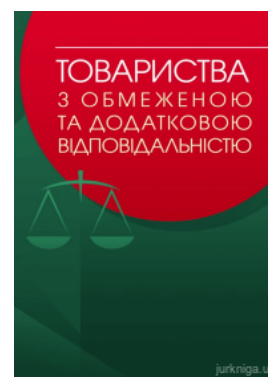
Товариства з обмеженою та додатковою відповідальністю: практичний посібник

Перейти до галузі права Міжнародне право