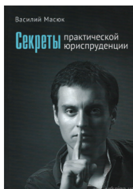
Секреты практической юриспруденции