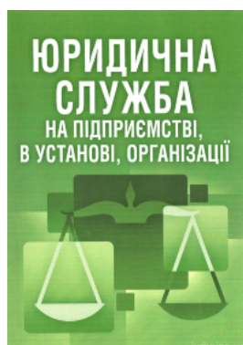
Юридична служба на підприємстві