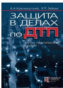
Защита в делах по ДТП Науч.-практ. пособ