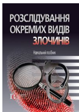
Розслідування окремих видів злочинів. Навчальний посібник