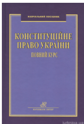
Конституційне право України. Повний курс