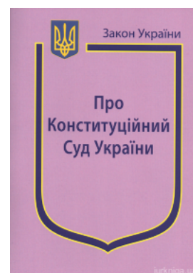
Закон України "Про Конституційний суд України"