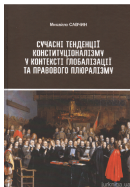
Сучасні тенденції конституціоналізму у контексті глобалізації та правового плюралізму