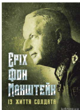
Із життя солдата