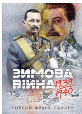
Зимова війна 1939-1940 рр.