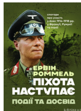
Піхота наступає. Події та досвід. Спогади про участь у боях 1914-1918 роках у Франції, Румунії та Італії