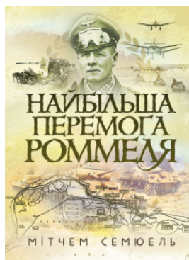
Найбільша перемога Роммеля