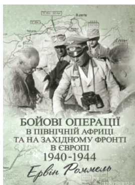
Бойові операції в Північній Африці та на Західному фронті в Європі. 1940-1944