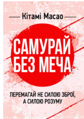
Самурай без меча. Перемагай не силою зброї, а силою розуму