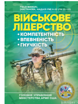
Військове лідерство: компетентність, впевненість, гнучкість. Універсальний навчальний посібник для рейнджерів