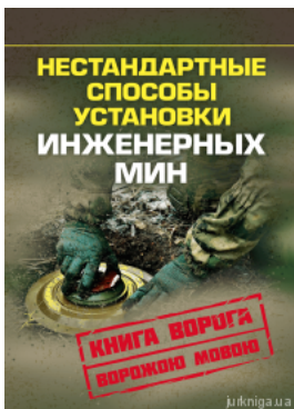
Нестандартные способы установки инженерных мин. Книга врага ворожою мовою