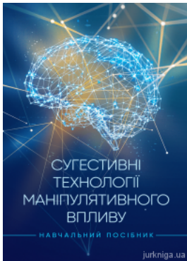
Сугестивні технології маніпулятивного впливу