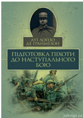
Підготовка піхоти до наступального бою