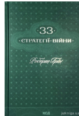
33 стратегії війни