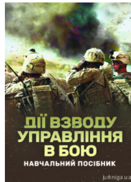
Дії взводу управління в бою