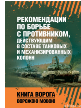
Рекомендации по борьбе с противником, действующим в составе танковых и механизированных колонн. Книга врага вражеским языком