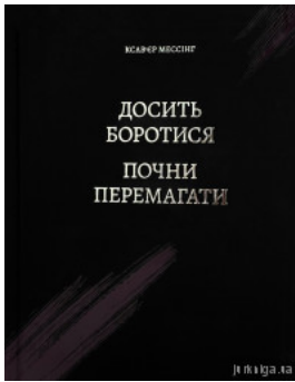
Досить боротися – почни перемагати