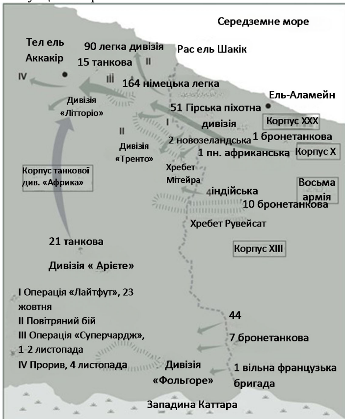
Сила наступу, продемонстрована в битві за Ель-Аламейн, 23 жовтня — 5 листопада 1942 року.

І хоча початкова ідея прориву в одну фазу не була досягнута, Союзникам вдалося «відкусити і утримати» значну ділянку німецьких позицій. Монтгомері знав, що йому потрібно вивести німців з рівноваги, і тому організував свій південний фінт. Атаки почалися, і, як і передбачалося, Роммель, який щойно повернувся з відпустки після лікування, не був упевнений, де знаходиться головний удар. Йому довелося залишити своє головне бронетанкове з'єднання, 21-шу танкову дивізію, та італійську дивізію «Аріете» в південному секторі, доки ситуація не проясниться.