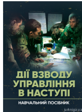
Дії взводу управління в наступі