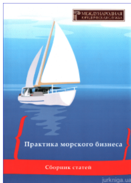
Практика морского бизнеса: сборник статей