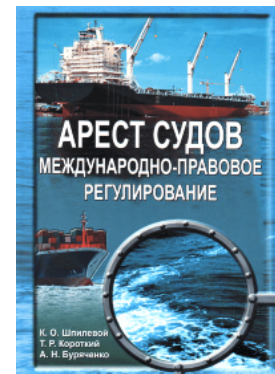
Арест судов. Международно-правовое регулирование