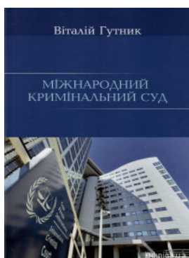
Міжнародний кримінальний суд