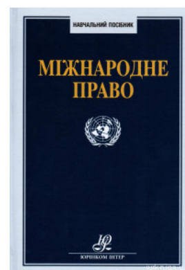
Міжнародне право. Навчальний посібник