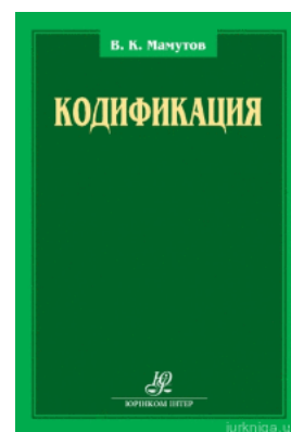
Кодифікація: збірник научних трудов

Перейти до галузі права Господарське право та процес