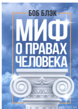
Миф о правах человека