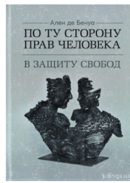
По ту сторону прав человека. В защиту свобод

Перейти до галузі права Філософія та психологія права