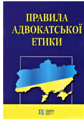
Правила адвокатської етики. Алерта