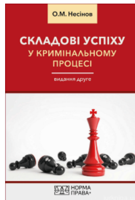
Складові успіху у кримінальному процесі. Видання друге