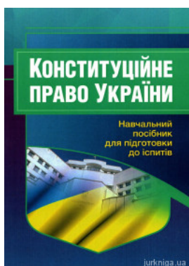
Конституційне право України. Навчальний посібник для підготовки до іспитів