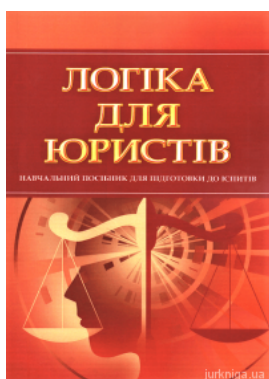
Логіка для юристів. Навчальний посібник для підготовки до іспитів