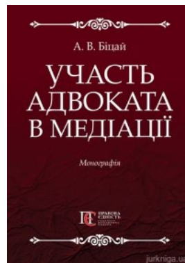
Участь адвоката в медіації