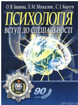
Психологія: вступ до спеціальності