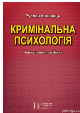
Кримінальна психологія. Навчальний посібник