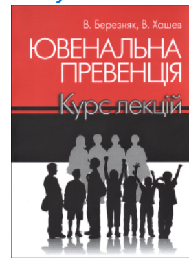
Ювенальна превенція. Курс лекцій

Перейти до галузі права Філософія та психологія права