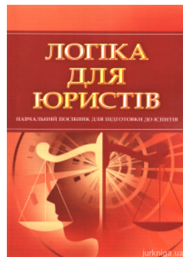
Логіка для юристів. Навчальний посібник для підготовки до іспитів