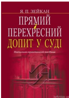
Прямий і перехресний допит у суді