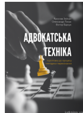
Адвокатська техніка (підготовка до процесу і методики переконання)