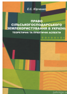
Право сільськогосподарського землекористування в Україні: теоретичні та практичні аспекти