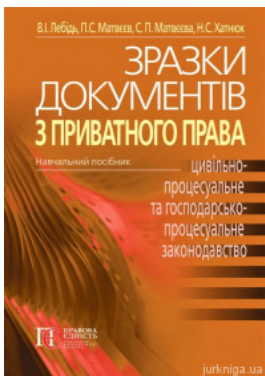
Зразки документів з приватного права (цивільне, сімейне, житлове, трудове, земельне, цивільно-процесуальне та госпо-дарсько--процес уальне...