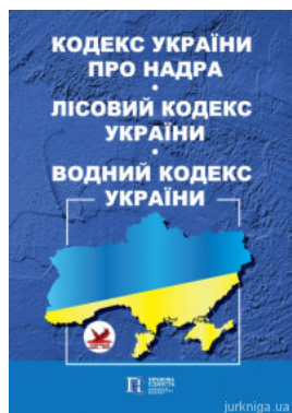
Кодекс України про надра. Лісовий кодекс України. Водний кодекс України. Алерта