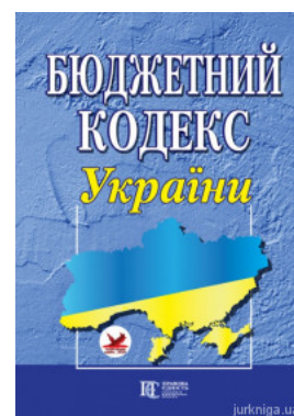
Бюджетний кодекс України. Алерта