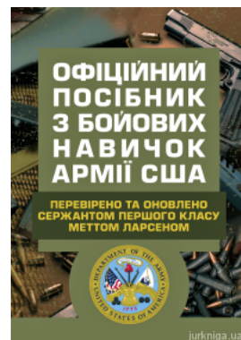
Офіційний посібник з бойових навичок армії США