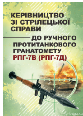
Керівництво зі стрілецької справи до ручного протитанкового гранатомету РПГ-7В (РПГ-7Д)