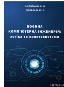
Воєнна комп'ютерна інженерія: логіка та криптосистема