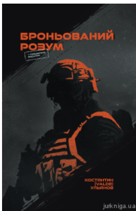
Броньований розум. Бойовий стрес та психологія екстремальних ситуацій