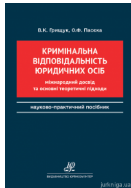
Кримінальна відповідальність юридичних осіб: міжнародний досвід та основні теоретичні підходи