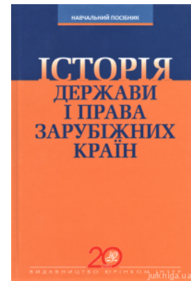
Історія держави і права зарубіжних країн