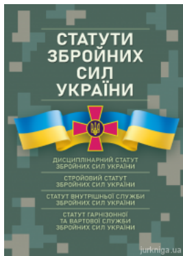
Статут збройних сил України