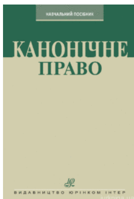
Канонічне право. Курс лекцій