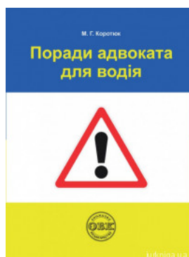
Поради адвоката для водія