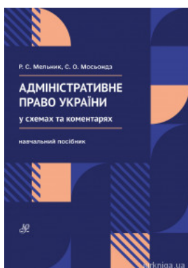
Адміністративне право України (у схемах та коментарях)