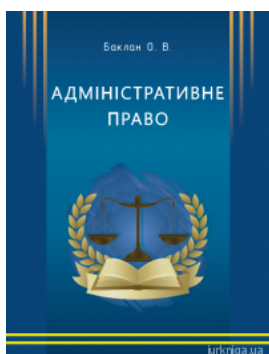
Адміністративне право. Курс лекцій

Перейти до галузі права Порівняльне правознавство