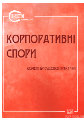
Корпоративні спори. Коментар судової практики