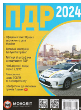
Правила дорожнього руху України 2024