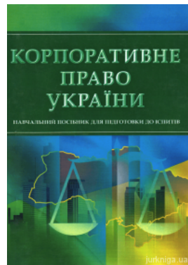
Корпоративне право України. Навчальний посібник для підготовки до іспитів