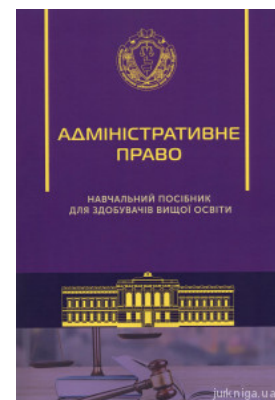
Адміністративне право. Навчальний посібник для здобувачів вищої освіти