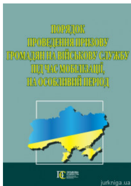
Порядок проведення призову громадян на військову службу під час мобілізації, на особливий період. Алерта