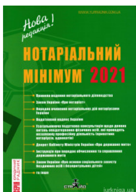
Нотаріальний мінімум 2021