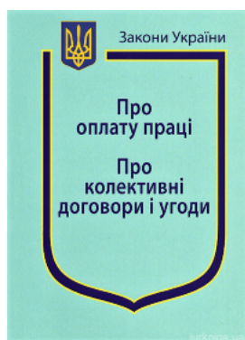
Закони України "Про оплату праці", "Про колективні договори і угоди"

Перейти до галузі права Административное право