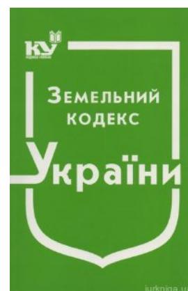
Земельний кодекс України

Перейти до галузі права Адміністративне право