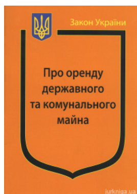
Закон України "Про оренду державного та комунального майна"