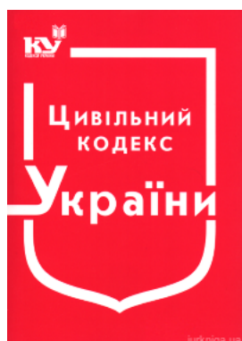
Цивільний Кодекс України