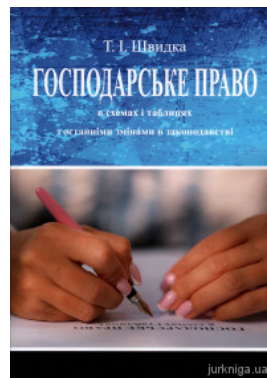
Господарське право в схемах і таблицях. Видання 6-те