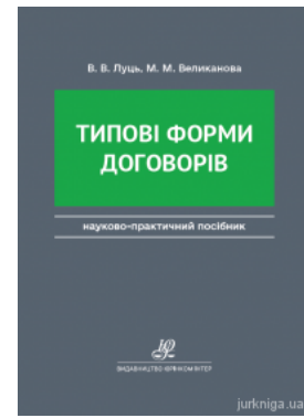
Типові форми договорів. Видання друге