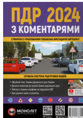
ПДР України 2024 з коментарями