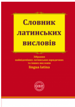
Словник латинських висловів