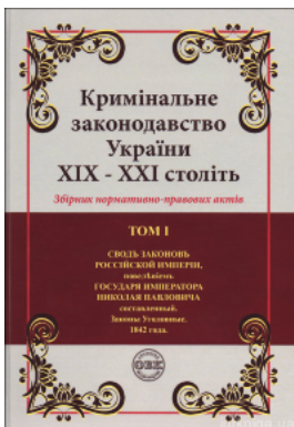
Кримінальне законодавство України XIX – XXI століть. Збірник нормативно-правових актів у 6-ти томах