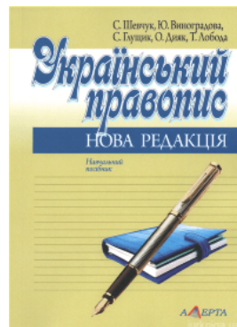
Український правопис: нова редакція. Навчальний посібник