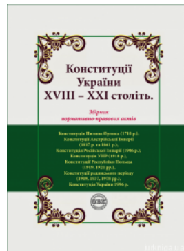
Конституції України XVIII – XXI століть: збірник нормативно-правових актів