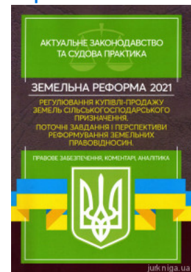
Земельна реформа 2021. Регулювання купівлі-продажу земель сільськогосподарського призначення. Поточні завдання і перспективи реформування земельних...

Перейти до галузі права Нотаріальне право