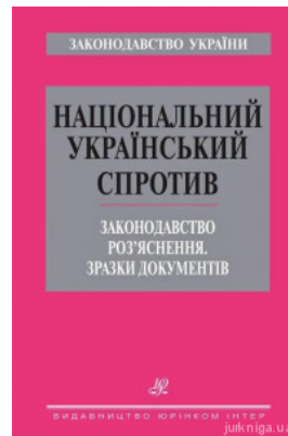
Національний український спротив. Законодавство. Роз'яснення. Зразки документів