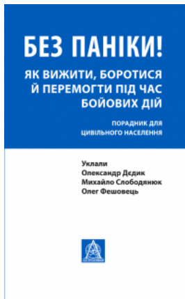
Без паніки! Як вижити, боротися й перемогти під час бойових дій. Порадник для цивільного населення