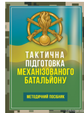
Тактична підготовка механізованого батальйону