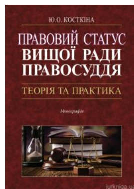
Правовий статус Вищої ради правосуддя: теорія та практика