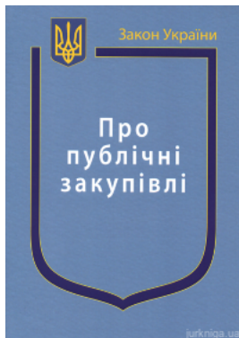
Закон України "Про публічні закупівлі"