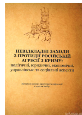
Невідкладні заходи з протидії російській агресії з Криму: політичні, юридичні, економічні, управлінські та соціальні аспекти : матеріали...

Перейти до галузі права Кримінальное право и процесс