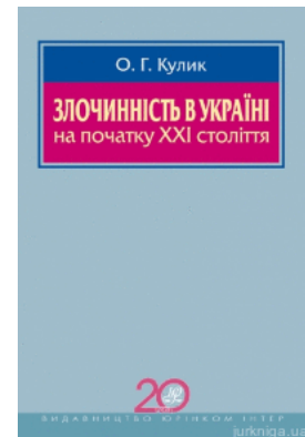
Злочинність в Україні на початку XXI століття