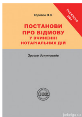
Постанови про відмову у вчиненні нотаріальних дій: зразки документів