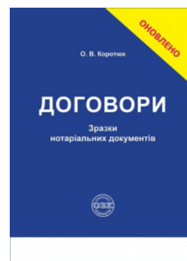
Договори: зразки нотаріальних документів