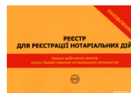
Реєстр для реєстрації нотаріальних дій. Зразки здійснення записів згідно Правил ведення нотаріального діловодства

Перейти до галузі права Нотаріальне право