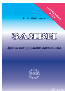
Заяви: зразки нотаріальних документів