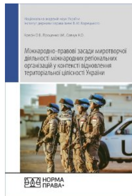
Міжнародно-правові засади миротворчої діяльності міжнародних регіональних організацій у контексті відновлення територіальної цілісності України