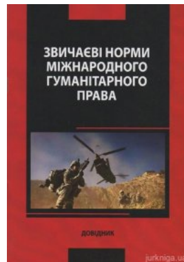
Звичайні норми міжнародного гуманітарного права