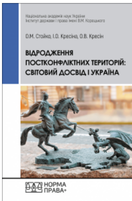
Відродження постконфліктних територій: світовий досвід і Україна