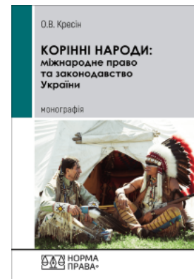
Корінні народи: міжнародне право та законодавство України

Перейти до галузі права Міжнародне право