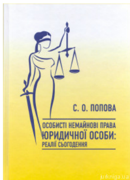
Особисті немайнові права юридичної особи: реалії сьогодення