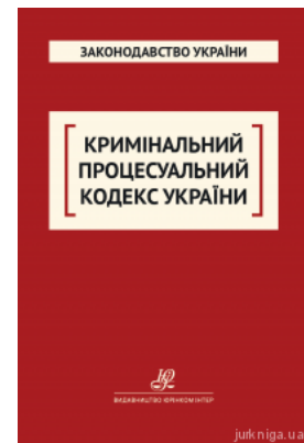
Кримінальний процесуальний кодекс України. Юрінком Інтер

Перейти до галузі права Цивільне право та процес