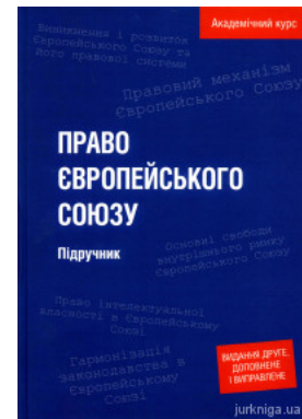
Право Європейського Союзу. Академічний курс