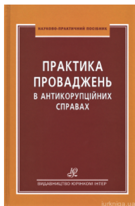
Практика проваджень в антикорупційних справах