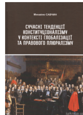
Сучасні тенденції конституціоналізму у контексті глобалізації та правового плюралізму

Перейти до галузі права Філософія та психологія права