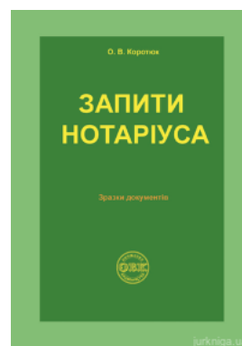
Запити нотаріуса: зразки документів