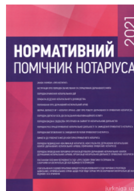
Нормативний помічник нотаріуса 2021

Перейти до галузі права Нотаріальное право