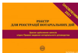
Реєстр для реєстрації нотаріальних дій. Зразки здійснення записів згідно Правил ведення нотаріального діловодства