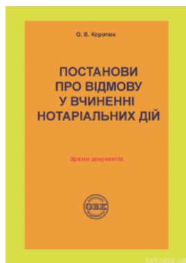
Постанови про відмову у вчиненні нотаріальних дій: зразки документів