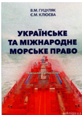
Українське та міжнародне морське право