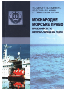
Міжнародне морське право: правовий статус науково-дослідних суден