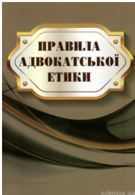
Правила адвокатської етики